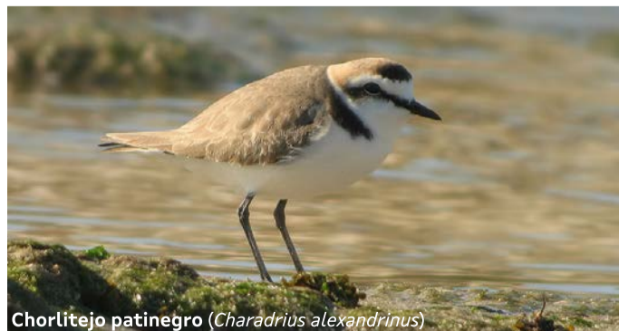
Chorlítejo patinegro ( Charadrius alexandrinus )

En las Piedras de los Charcos y en la playa de O Vilar podemos observar todo el año aves especialistas como el ostrero euroasiático ( Haematopus ostralegus ) y el vuelvepiedras común ( Arenaria interpres ), el invernante correlimos tridáctilo ( Calidris alba ) y cría en primavera el chorlítejo patinegro ( Charadrius alexandrinus ).