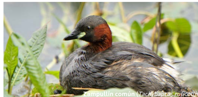
Zampullín común ( Tachybaptus ruficollis )

La laguna de Vixán da cobijo a especies nidificantes como el carricero común ( Acrocephalus scirpaceus ), la gallineta común ( Gallinula chloropus ), el ánade azulón ( Anas platyrhynchos ) o el zampullín común ( Tachybaptus ruficollis ) y otras invernantes poco frecuentes en Galicia, como el avetorillo común ( Ixobrychus minutus ), el aguilucho lagunero ( Circus aeruginosus ) y un raro endemismo como el escribano palustre iberoccidental ( Emberiza schoeniclus lusitanica ), considerada en peligro crítico de extinción.